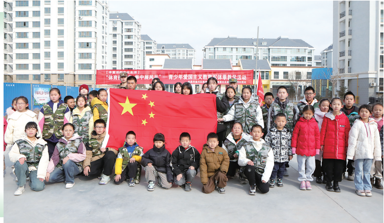
►为磨练青少年的身体素质和意志品质,2月1日,金川区新华路街道昌丰里社区特邀“戎耀老兵”退役军人志愿者为辖区青少年开展“小战士”军体拳训练活动,辖区30余名未成年参加了活动。