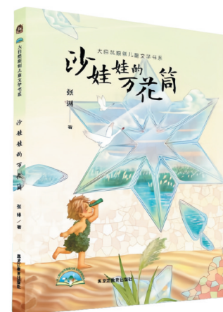
《沙娃娃的万花筒》，张琳著，黑龙江教育出版社出版。

儿童文学作家张琳的新作《沙娃娃的万花筒》，是一部独具匠心的生态小说。更准确地说，它是一部以石羊河流域生态保护及沙漠治理为背景的长篇儿童幻想小说。