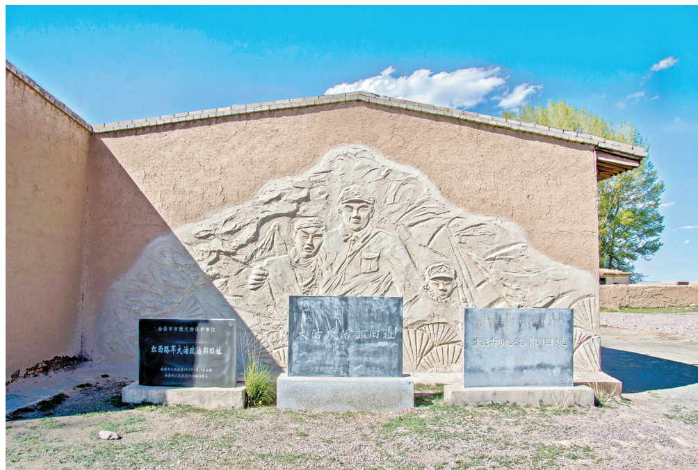
▲永昌县大治政治部旧址墙绘雕塑。

整个抗战时期，永昌县平均每年筹集军需粮秣及各项赋税折合粮食515万公斤，约占粮食总产量的22%；八年间累计交纳粮食4120万公斤，人均负担810公斤。这些数据背后，是永昌人民节衣缩食、勒紧裤腰带支援抗战的真实写照。