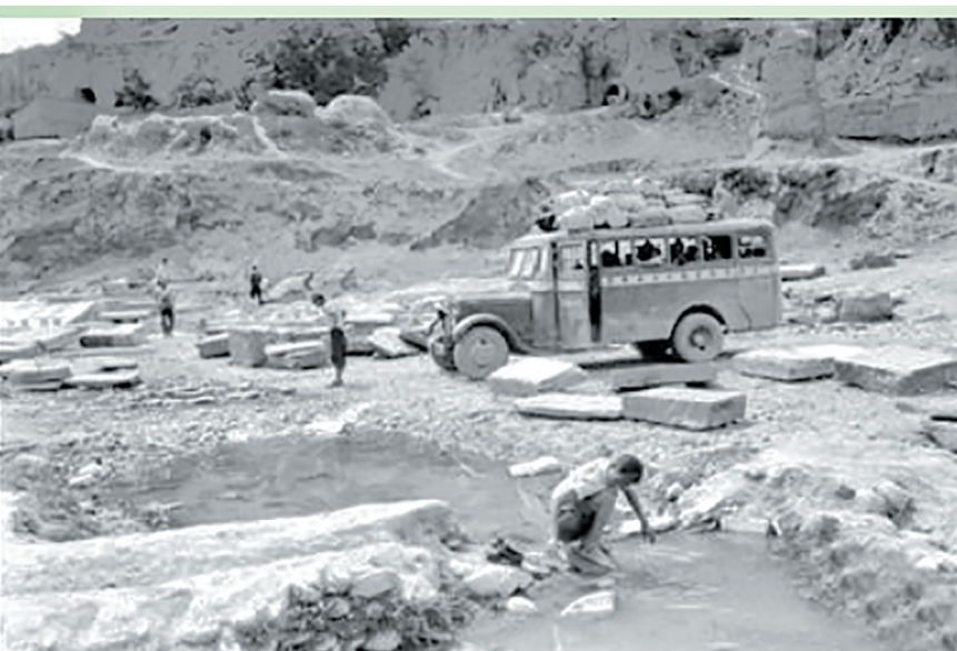
左图：中苏《互不侵犯条约》；右图：抗战时期，甘新公路交通状况。（资料图）