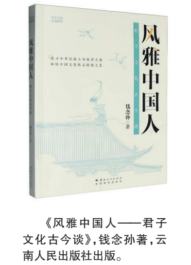
《风雅中国人——君子文化古今谈》，钱念孙著，云南人民出版社出版。

科学院资深研究员钱念孙先生的新著《风雅中国人——君子文化古今谈》，对此给出了深刻而富有启发的回答。 钱念孙先生是学界公认的大家，曾五次荣获全国“五个工程”奖等国家级重磅奖项，其学术功底深厚，视野宏阔。在这部新作中，他以“风雅中国人”这一极具概括力和感染力的概念加以界定与阐发，以“君子文化古今谈”为线索，构建了一个贯通古今的阐释框架。 本书系统梳理了君子文化两千多年的发展脉络，着力挖掘其与当代社会的深刻契合点。它回答了在新的历史条件下，我们为何仍需倡导君子品格，以及如何培育君子品格。书中强调，“人人皆可为君子，做新时代君子”，这一价值追求打破了君子高不可攀的传统迷思，赋予其民主性、实践性