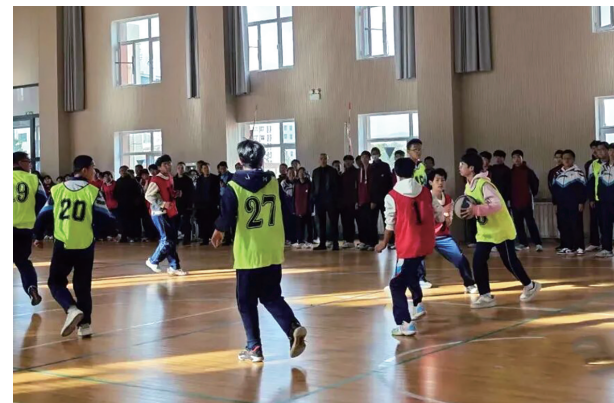
风雨操场是一种多功能室内运动场地，其名源于“风雨无阻”的特性。这是学生们在金川区双湾中学风雨操场活动。

针对困境儿童，我市建立起多层次保障体系：落实孤儿和事实无人抚养儿童基本生活保障，累计发放生活补助及助学金236万元；将孤独症儿童康复纳入医保，实现残疾儿童康复救助“一人一案”全覆盖。同时，健康守护全面覆盖，高质量完成省列民生实事——适龄女童HPV疫苗接种项目，为1200名适龄女童完成首剂接种；选优配强18个乡镇（街道）的儿童督导员及182个村（居）民委员会的儿童主任，夯实基层儿童工作基础；开展“爱心妈妈”等关爱服务，守护每一个孩子的成长。经过一年积极建设，我市入选第四批国家儿童友好城市建设名单。