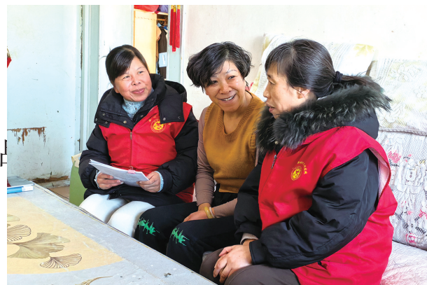
金川区桂林路街道宝里社区网格员入户宣传金川区公租房租赁申请政策。

全市民政系统秉承“为老、适老、实用”原则，坚持高标准规划设计，高效率组织实施、高质量管理运营，抢时间保进度，强监管保质量，抓衔接保运营，全力完成省市政府为民办实事任务。目前全市共建成村级互助幸福院93所，乡镇（街道）综合养老服务中心11所，城市社区日间照料中心41所，覆盖率分别达到66.9%、61.1%、95.3%，为老年人提供生活照料、文化娱乐、医疗康复、心理慰藉等服务，有效解决留守、孤寡、独居老人养老难题，充分满足老年人多样化、多层次的养老服务需求，让老年人获得感成色更足、幸福感更可持续、安全感更有保障。