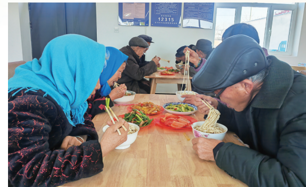
金川区双湾镇康盛村的老人在新落成的互助幸福院内用餐。

2025年，我市持续升级社区养老服务，积极推进市级为民办实事项目，投资60万元新建金阳里、金都里社区2所日间照料中心，主要设置老年食堂、乒乓球室、棋牌室等功能室，不仅解决了老年人“一顿饭”的问题，更成为他们社交、娱乐、增进健康的平台。