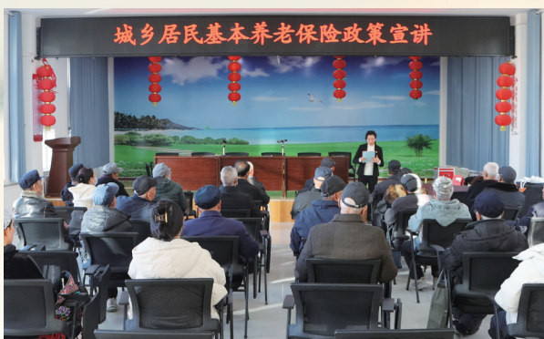
金川区人社局工作人员在金川区宝里社区开展政策宣讲。

2025年，我市将“提高城乡居民基础养老金最低标准”列为年度十件民生实事，继2024年城乡居民基础养老金最低标准上涨10元后，每人每月再提高20元，筑牢城乡居民养老底线。