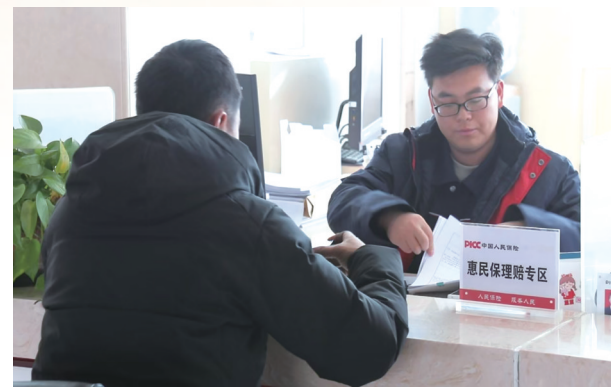
保险公司窗口服务人员正在帮投保群众办理“锦都惠民保”理赔业务。

“锦都惠民保”是2025年市政府承办的民生实事项目之一，分为“69元”和“99元”两档投保选择，参加城乡居民基本医疗保险的参保人员还可享受每年单30元的政府财政补助。“锦都惠民保”作为政府指导的普惠型补充医疗保险，具有保费低、保额高、支持带病参保、保障范围同基本医疗保险衔接等优势特点，不仅可以报销医保目录内和目录外的住院医疗费用，还能有效补充报销基本医保覆盖范围以外的65种特定高额药品费用和质子重离子医院医疗费用。