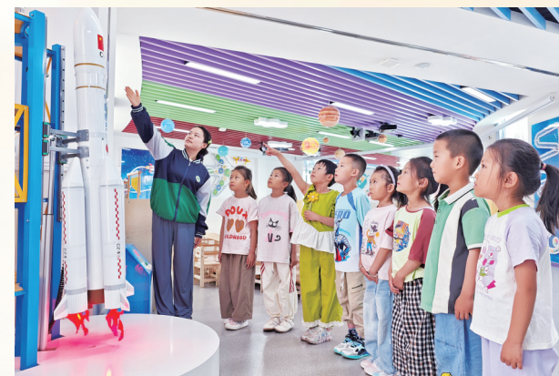
在我市首家儿童友好学校金川区第一幼儿园的 科学探索空间内，老师为孩子们普及航天知识。

2025年，我市把“儿童公共服务设施改造”列入民生实事项目，加大建设力度，使儿童公共服务设施得到极大改善。2025年全市投入143.81万元，实施16项儿童设施改造，建成4个示范社区、3个友好公园、2个特色场馆、1所友好医院，优化5处交通设施，儿童户外活动与出行安全显著提升。