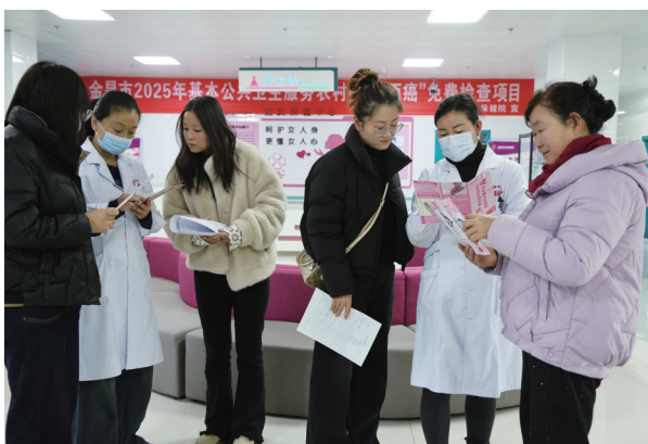
在金昌市妇幼保健院，医生对患者咨询、就诊的患者进行“两癌”知识宣传。

2025年，我市将城乡低收入妇女“两癌”救助项目纳入市政府为民生实事，由市妇儿工委牵头，市妇联、市财政局配合，永昌县、金川区政府具体实施，旨在切实缓解患病妇女家庭经济压力，巩固拓展脱贫攻坚成果。