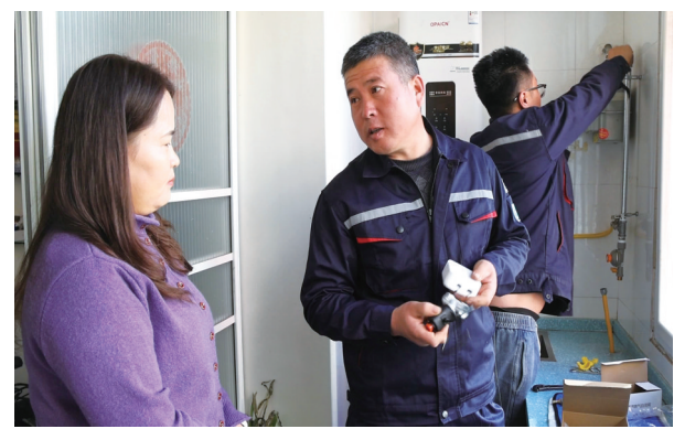
金昌中石油昆仑燃气有限公司安检员正在进行安全检查，并给用户讲解天然气报警原理。

“锦都惠民保”的推出，是我市在完善多层次医疗保障体系道路上迈出的重要一步，它不仅减轻了众多患者家庭的经济压力，也让广大市民切实感受到了党和政府对人民群众健康福祉的关心关怀，它与基本医疗保险、大病保险、医疗救助等共同构成了市民的医疗保障网络，为广大市民的健康保驾护航。