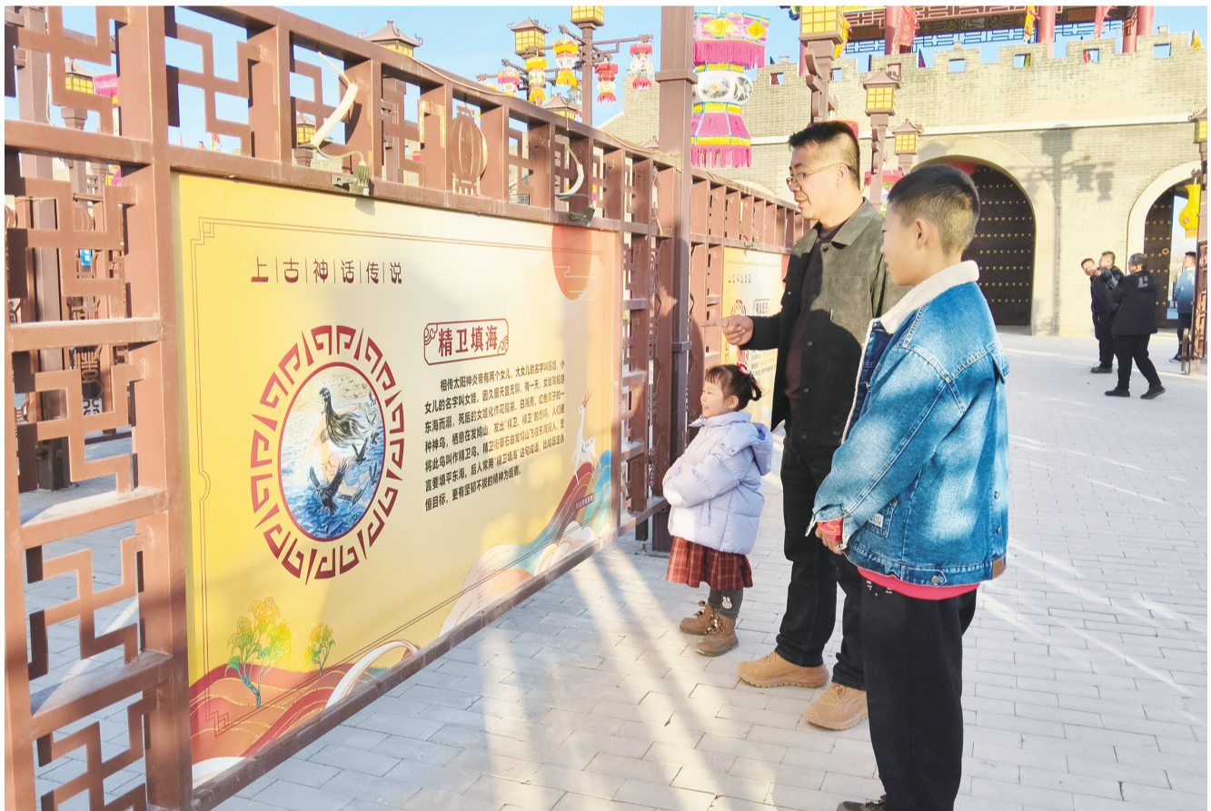
春节假期，我市处处洋溢着喜庆的节日氛围，人们纷纷走出家门，放松休闲，感受浓浓年味。图为2月19日，游客在永昌县红山窑镇毛喇卍字灯城游览。