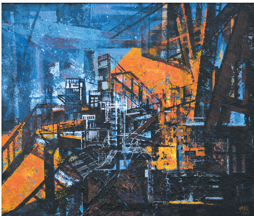
▲工业长歌(综合材料) 南明翰 作

千峰雲起驟雨一霎兒價更遠樹斜陽風景怎生圖看青 旗賣酒山那畔別有人家祇消山水光中無事過這一夏 午醉醒時松牕竹戶萬千蕭洒野鳥飛來又是一般閑瑕却 怪着白鷗顧着人欲下未下舊盟都在新來莫是別有說話 三徑初成鶴怨猿驚稼軒未來甚也山自許平生意氣衣冠 人笑抵死塵埃意倦須還身閑貴早豈為花羨鱸膾秋江 上看鷺鴦雁避駭浪舟回東崗又揖芳齋好都把軒窗臨水開 要小舟行釣應先種柳疎籬護竹莫碍觀梅秋菊堪餐春蘭 可佩留待先生手自栽