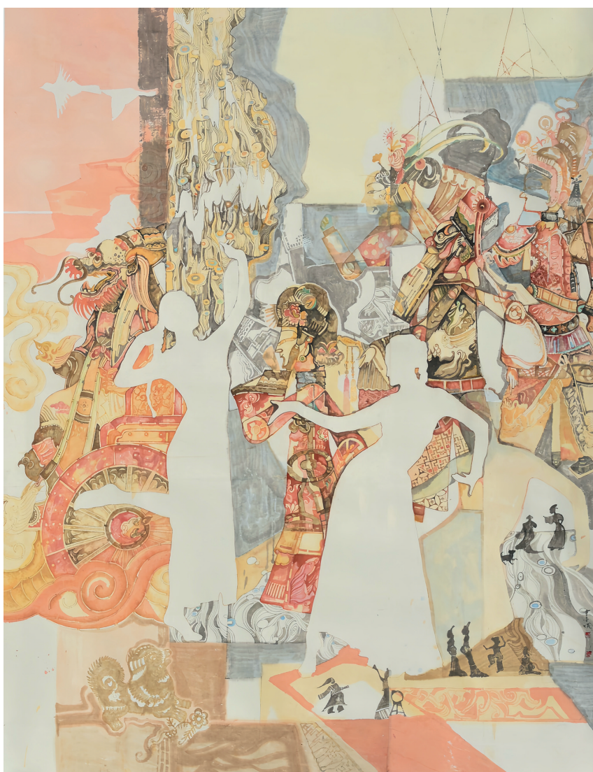
▲皮影·新韵(国画) 曹小娟 作