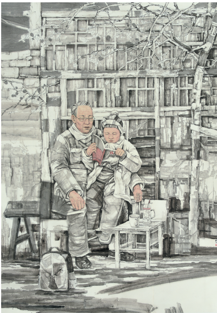
▲红色故事代代传(国画) 李晓琴 作