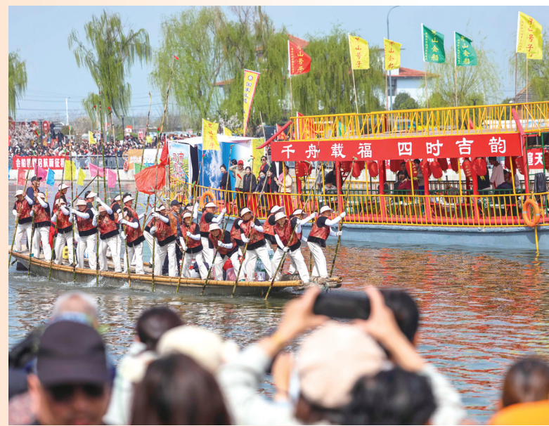
4月5日,选手参加茅山会船盛会。4月5日,江苏省兴化市举行一年一度的茅山会船盛会。船只和选手齐聚茅山西大河,参加竞技和表演。茅山会船始于南宋,2014年被列入国家级非物质文化遗产名录。