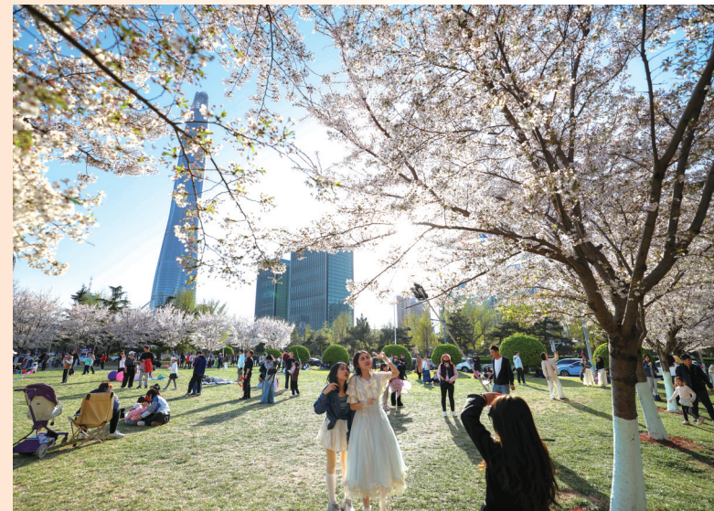
4月5日,市民在天津滨海新区泰达城市广场休闲。清明小长假期间,人们踏青赏景,乐享春光。